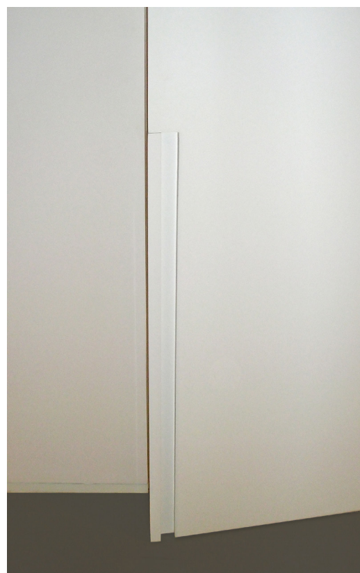
B Vertic voor pivoterende deuren