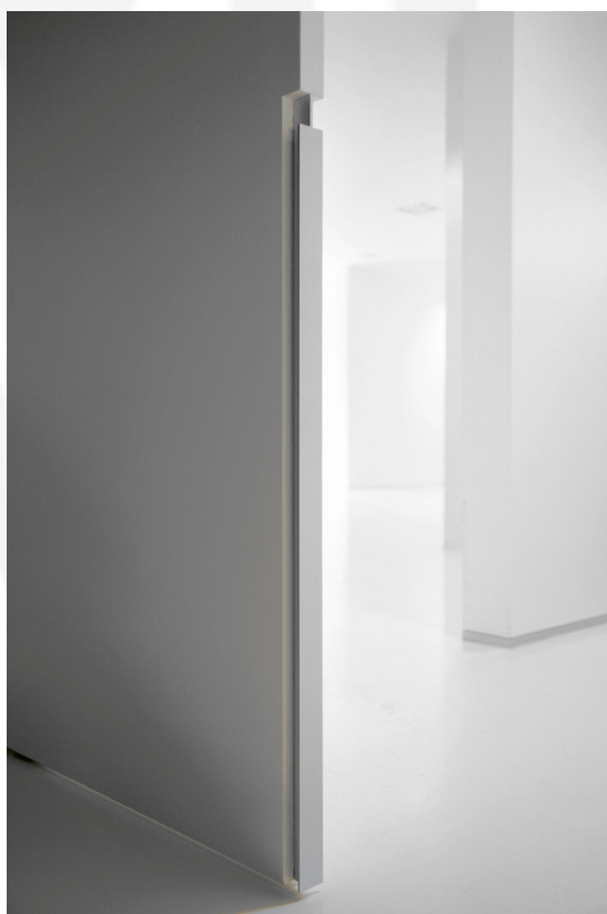
B Vertic voor schuifdeuren